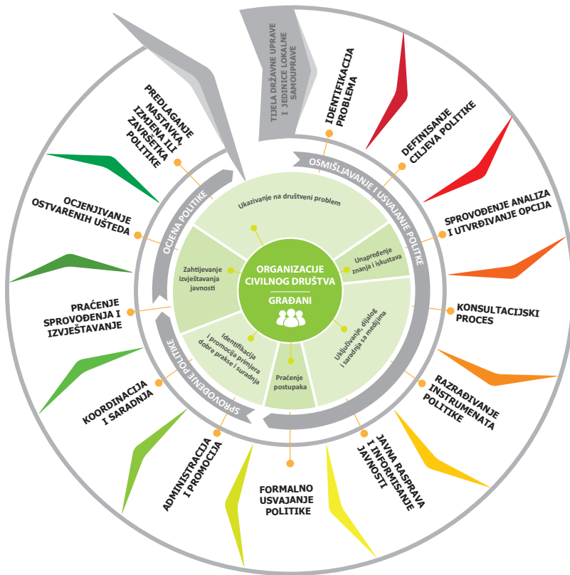
Slika 1. Proces javnih politika

Transparentnost postupka i priključivanje velikog kruga učesnika u sve korake ovog procesa, ključni su za prihvatanje, a time i uspješnost javnih politika. Učesnici uključivanjem dobijaju osjećaj „vlasništva“ nad politikom u čijoj su izradi djelovali, što povećava predanost u sprovođenju istih.